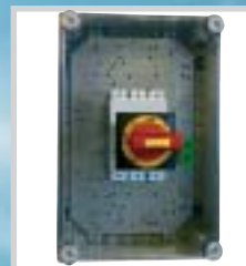
Kapslet...VR for kobber