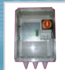
Kapslet...VR-AL for aluminium